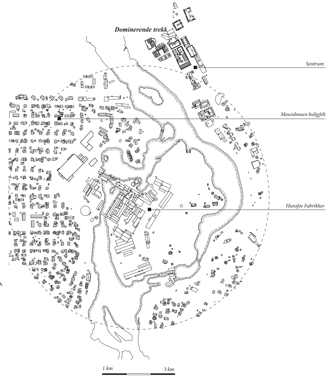
Landskapets betingelser for bebyggelse og bosetning

De lange linjene i terrenget dannes av dalene som oftest er forkastningslinjer i retning syd – vest og nord – øst. Forkastning er et geologisk begrep som betegner bruddflate i fjell. Bruddflaten danner grensen mellom to bergartsblokker eller fjellpartier som har beveget seg i forhold til hverandre. 5