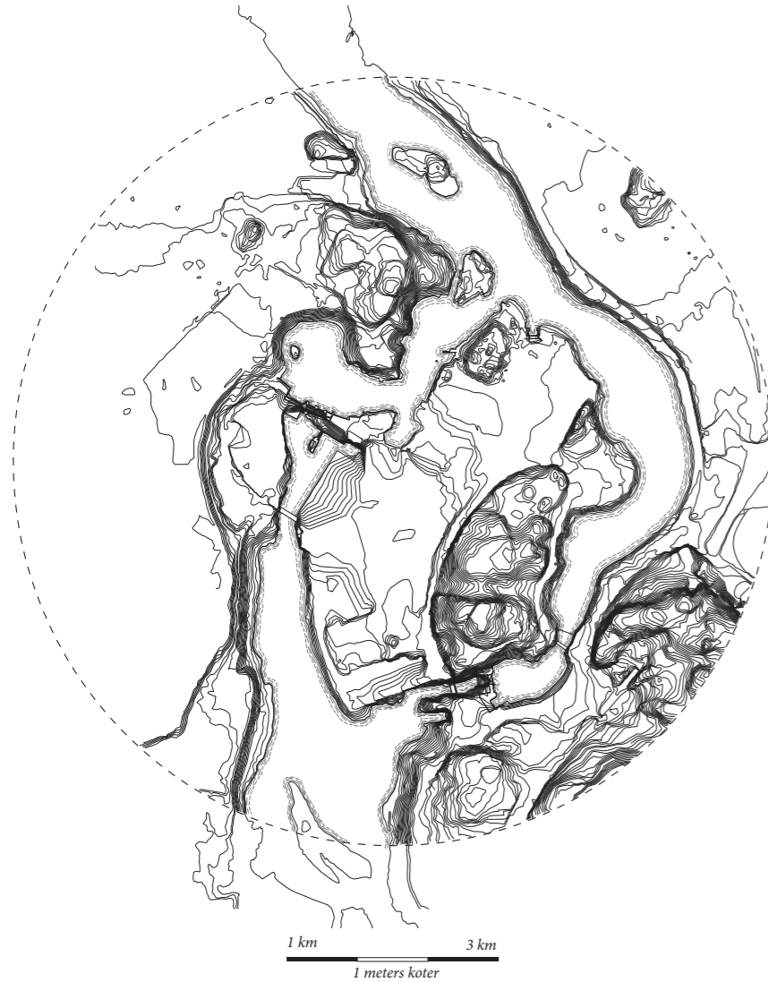
Topografiske forhold på sitet