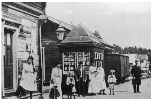
I 1896 ble Setesdalsbanen åpnet etter press fra Hunsfos Papirfabrikk. Jernbanens forbindelse var av enorm betydning for byen og befolkningsveksten