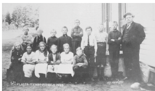
Etter skoleloven i 1860 skulle det være egen skole for de ansattes barn på fabrikker med minst 30 ansatte. I 1893 ble det bygget eget skolehus på Hunsøya